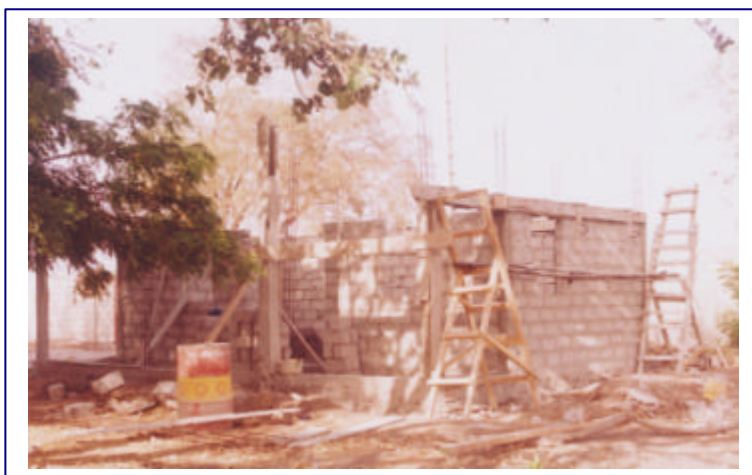
Construcció sales d'estudi