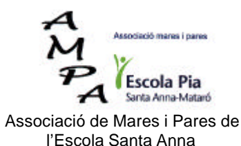
Associació de Mares i Pares de l'Escola Santa Anna