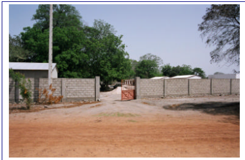
Tanca exterior del centre