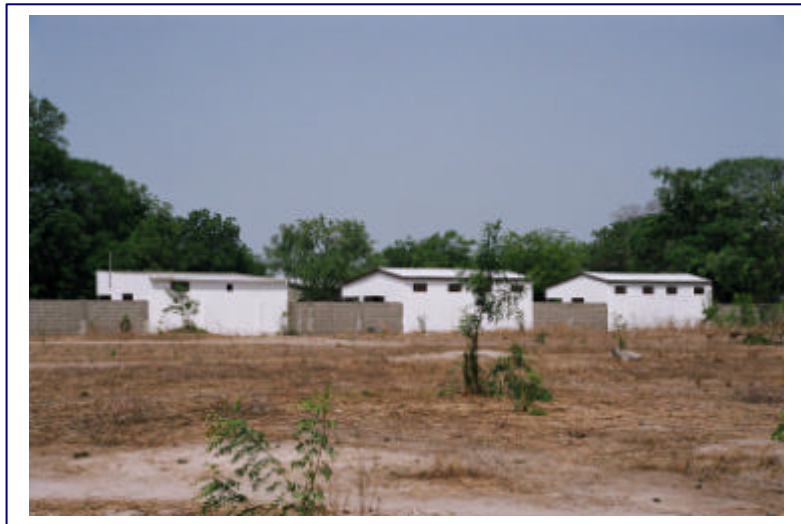
Vista exterior del centre