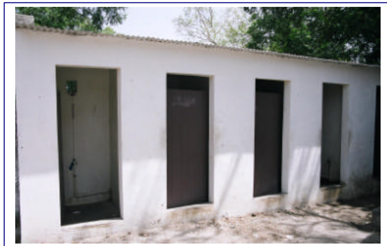
Lavabos i dutxes