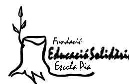
Fundació Educació Solidària