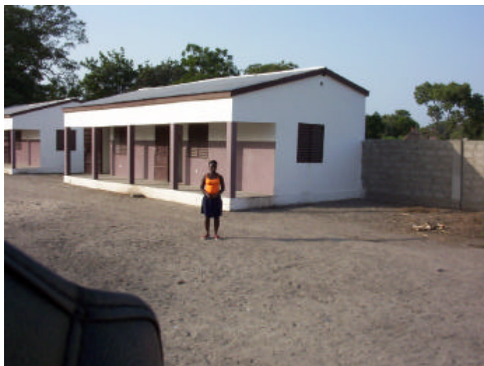
Una de les casetes amb capacitat per a vuit alumnes