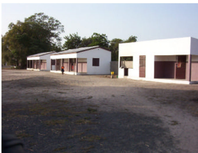
En primer terme la cuina i el rebost, darrera dues de les casetes