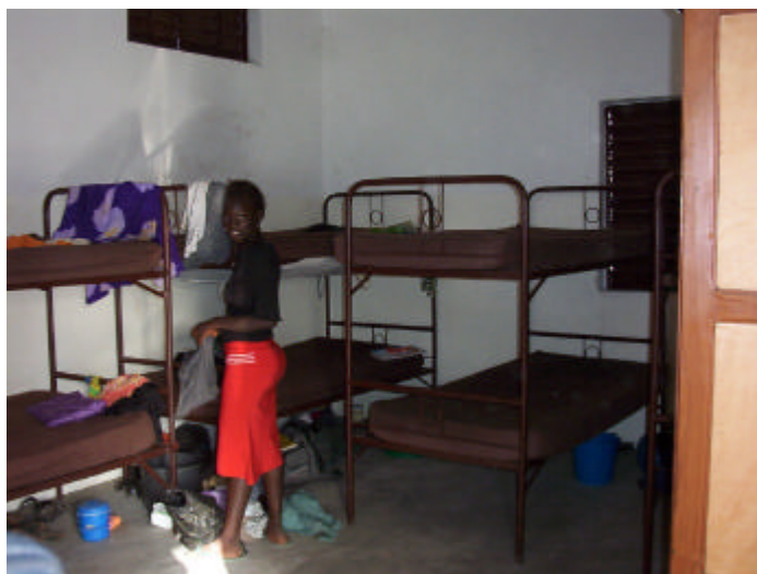
Interior d'un dels habitatges