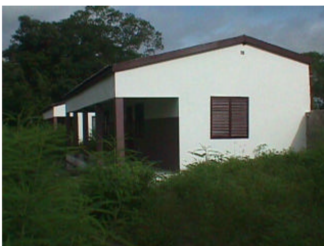
Estat del terreny després del període de pluges, quan encara no havien arribat els alumnes.