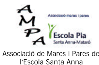
Associació de Mares i Pares de l'Escola Santa Anna