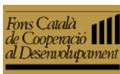
Fons Català de Cooperació al Desenvolupament