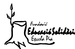
Fundació Educació Solidària