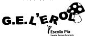
Grup d'Esplai l'Erol