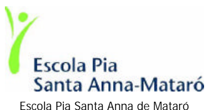
Escola Pia Santa Anna de Mataró