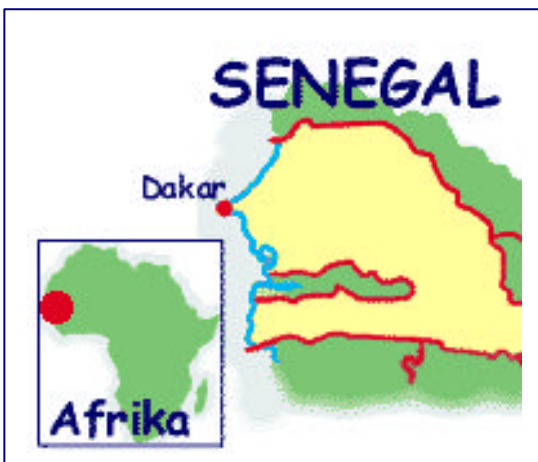
Mapa Senegal i situació dins Àfrica